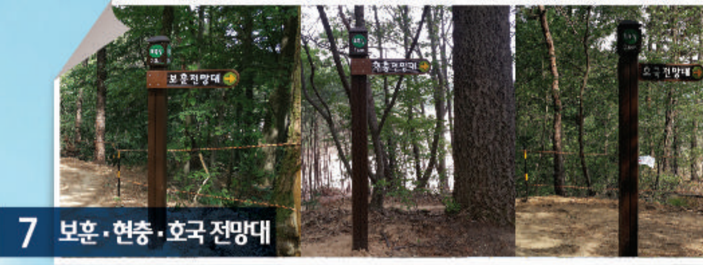
7 보훈·현충·호국 전망대