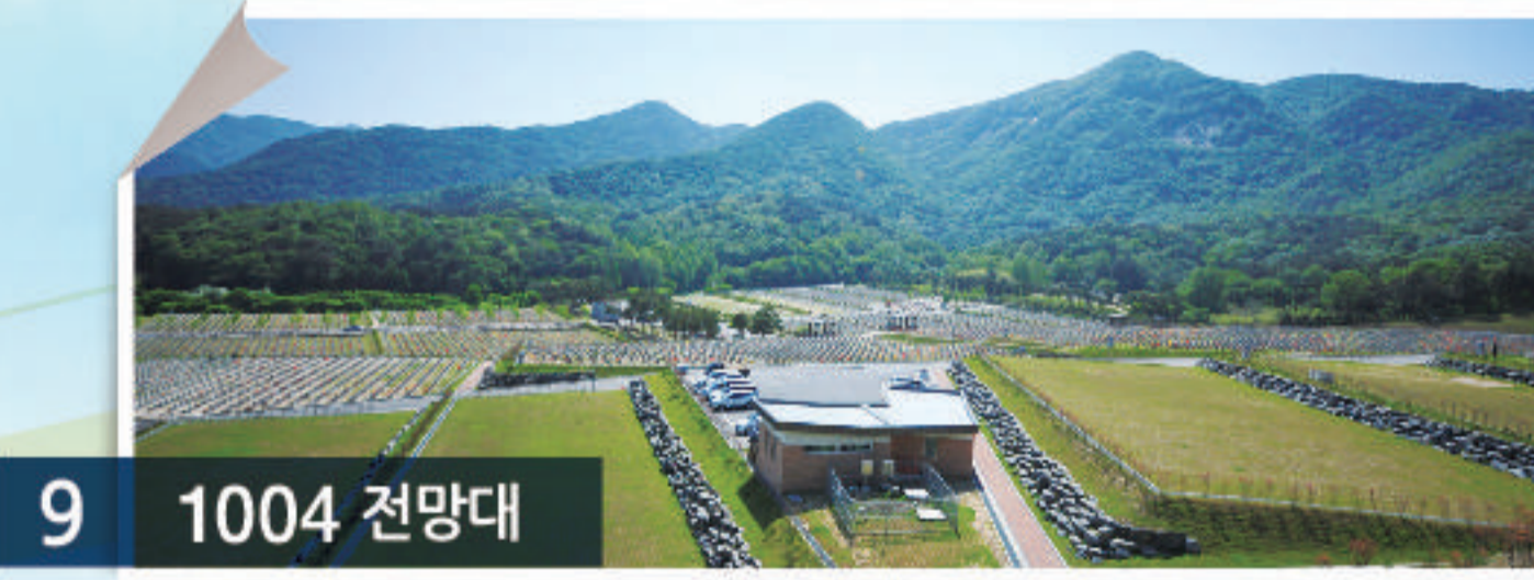
9 1004 전망대